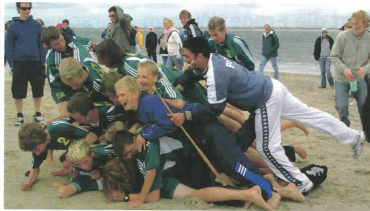
Das Jugendteam jubelt nach dem 48:34-Sieg auf Langeoog.

12.12.: Die Mitglieder des Spiekerooger Sportvereins bestätigen bei den Neuwahlen den kompletten Vorstand.