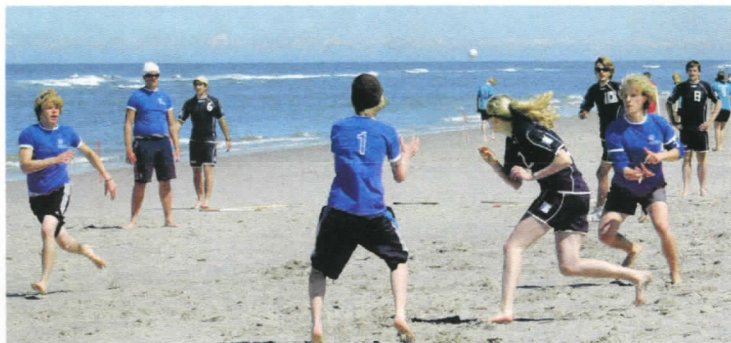
Ein knappes Ding: Lietz United (hellblau) wirft eine Kölnerin ab.