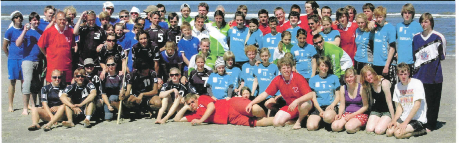
Alle für einen Sport: Fünf Mannschaften nahmen am 7. Himmelfahrtsturnier der Lietz-Schule am Badestrand teil.