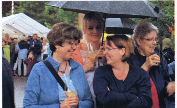
Regen? Na und! Hauptsache in das Glas Bowle fließt kein Wasser rein.

Stimmung tat das nasse Intermezzo zunächst keinen Abbruch: Zwei weitere Regengüsse überraschten die Besucher aber im Laufe des Abends. Binnen weniger Stunden fielen 25 l/m 2 Niederschlag (Quelle: OOVV). Zu diesem Zeitpunkt war klar: Dieses Dorffest wird in keinem Buche stehen! So eine Veranstaltung überlebt nur, wenn die Teilnehmer Kummer gewöhnt sind. Denn trotz durchnässter Kleidung, überfluteten Straßen und unbenutzbaren Bierbänken ließen sich Gäste und Einheimische die Laune nicht verderben. Straßenfest bei Sonne kann jeder! Dorffest bei Schauerwetter kann so nur Spiekeroog! Gehört der Regen schon zum Dorffest mit dazu wie der Musikverein? Am Dienstag, 24. Juli 2018, gibt es für ein trockenes Dorffest eine neue Chance! Fotos und Text zum Dorffest finden Sie auf den Seiten 6 + 7 .