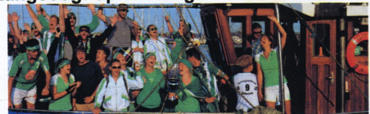
2015 fuhren die Spiekerooger mit dem Krabbenkutter nach Langeoog. Diesmal holt sie das Schiff Langeoog II ab.

Spiekeroog – Das Projekt „Titelverteidigung“ beginnt für Spiekeroogs drei Schlagballteams sowie die Volleyballmannschaft am Dienstag, 1. August, um 7 Uhr. Dann nämlich fährt das Langeooger Schiff ab Spiekeroog-Hafen zum Inselwettkampf nach Langeoog – mit etwa 60 Aktiven und hoffentlich vielen Fans an Bord. Die frühe Abfahrt stört auf der Insel niemanden: Nach dem Fiasko mit der Langeooger Schifffahrt vor zwei Jahren muss man als Spiekerooger ja dankbar sein, überhaupt mitgenommen zu werden. Wer die Sportler am Dienstag begleiten möchte, kann in der Kogge oder