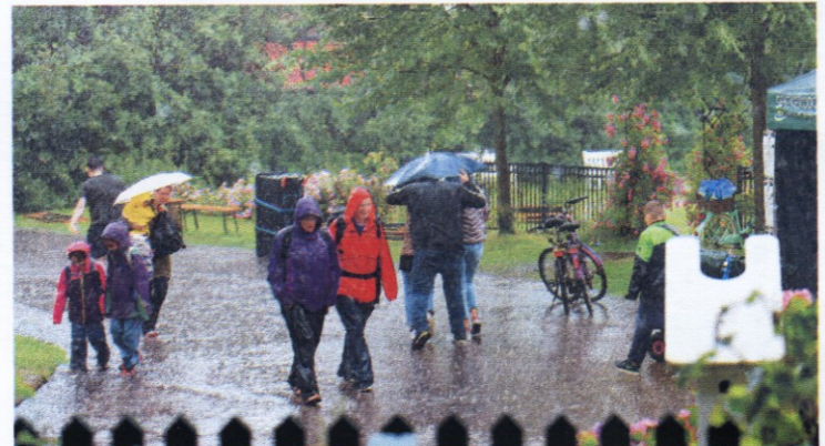
Warum Straßenfest? Weil es für die Regentropfen ein Fest ist, auf Spiekerooger Straßen zu klatschen!