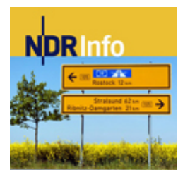
NDR-Reportage über Lietz