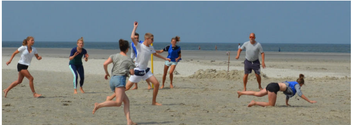
Auch abseits der drei Wettkampfmansschaften spielen Schlagballfreunde in gemischten Teams.