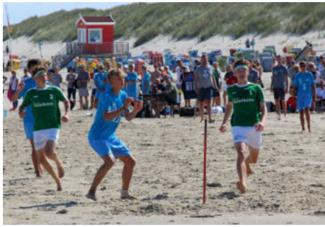
1:1: Die U 18 mit den Inselboten-Trikots