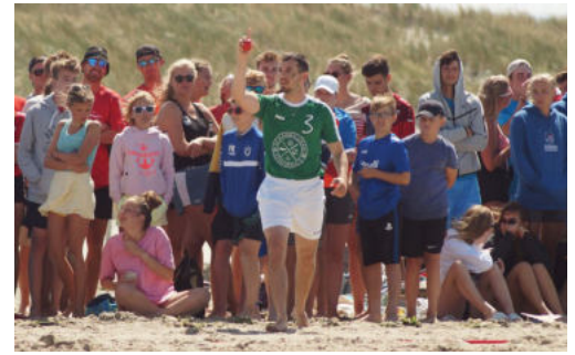
3:1: Das Herrenspiel mit vielen Fangpunkten