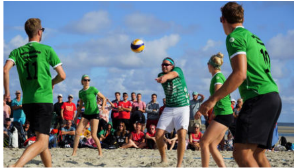
0:1: Spiekeroogs Volleyballer beim Spielaufbau