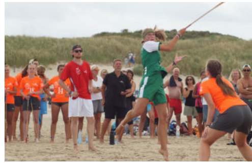
2:1: Damen-Team gegen Oranje-Langeoog